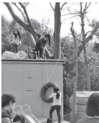
子どもは遊びの天才！

議員 錦町のちびっこ広場No.34に「どろんこの王様」が開設し、13年目を迎えるプレーパークは、錦町土地区画整理事業のため、今年の9月以降に広場を利用できない状況にある。子どもたちの知力・体力や五感の力を伸ばせるような、自然が残る貴重な遊び場となっているが、今後の市のサポートはどのようなか。