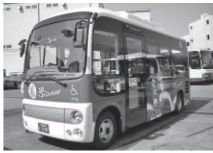
市民の足として喜ばれている「ぷらっとわらび」

議員 コミュニティバスのルート拡充に向けた検討状況やスケジュールはどのようか。 市民生活部長 西ルートの逆回り運行、市役所や市立病院へのアクセス向上、中心市街地活性化の一助として駅前通りの運行、河鍋暁斎記念美術館付近のバス停の新設と南町3丁目、4丁目へのルートの延伸を基本的な考え方として、運行事業者や警察等の関係機関と協議を進めている。12月の運行開始を目指している。