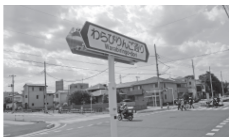
新しい幹線道路に、親しみを込めて名前をつけよう