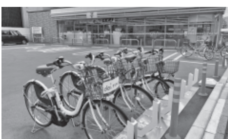
さいたま市のセブンイレブンにある自転車シェアリング