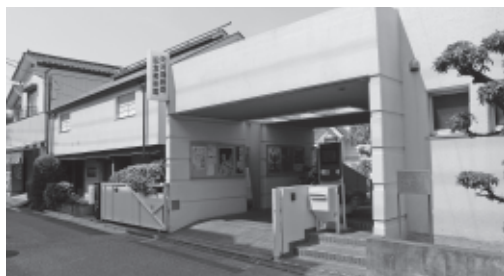
河鍋曉斎記念美術館（南町4丁目）